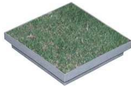
Esempio di applicazioni